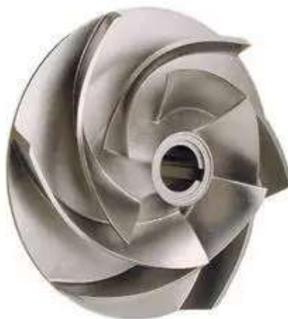
Gambar 2 Impeller

Material yang dipakai pada Impeller Cargo pump MT Cipta Anyer harus memiliki daya tahan yang tinggi akan korosi terhadap HCl. Maka dari itu bahan dari material Impeller itu sendiri adalah Hastelloy X & Tantalum , yang merupakan bahan tahan akan korosi akibat paparan HCl 33%. Menurut (Umurani et al., 2023) impeller adalah komponen dari blower sentrifugal yang berputar dari pompa sentrifugal yang memiliki fungsi untuk mentransfer energi dan motor dengan mempercepat fluida keluar dari pusat rotasi. Adapun menurut (Vergiansyah & Siregar, 2019) impeller merupakan salah satu komponen yang dapat meningkatkan performa dari pompa sentrifugal. Menurut (Siregar & Damanik, 2020) Pompa Sentrifugal ialah pompa yang digunakan untuk memperbesar energi fluida melalui prinsip gaya sentrifugal.