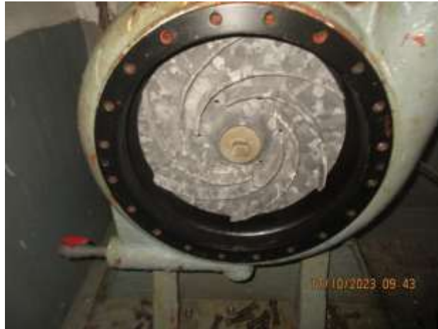
Table 3 Spesifikasi Impeller