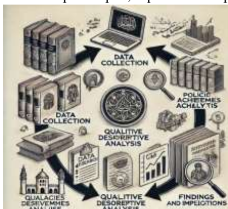
Gambar 1. Diagram Alur Penelitian

Penelitian dilakukan melalui beberapa tahapan, seperti terlihat pada diagram di bawah ini: