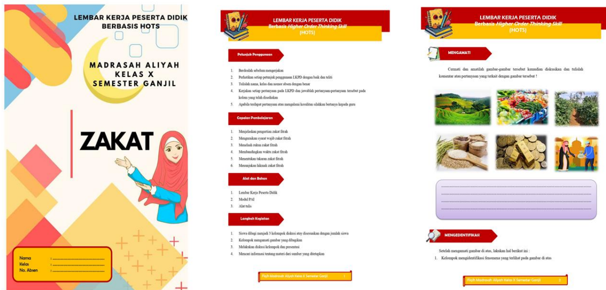
Gambar 2. Design LKPD Berbasis HOTS

akan dikuasai pada proses pembelajaran. Pada kegiatan pembelajaran ini bertujuan untuk mencapai kompetensi dasar yang telah ditetapkan, dalam pengembangan LKPD berbasis HOTS terdapat 6 pembelajaran. Tahapan evaluasi merupakan untuk menguji pemahaman peserta didik pada materi yang telah diajarkan. Adapun desain LKPD berbasis HOTS disajikan pada gambar 2.