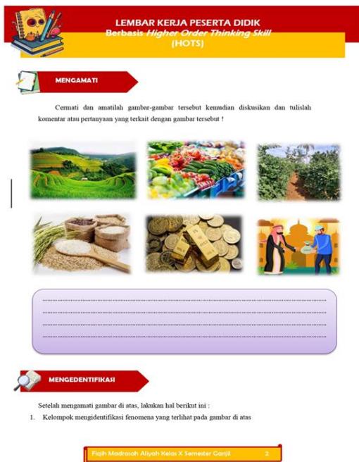
Gambar 3. LKPD Sebelum direvisi