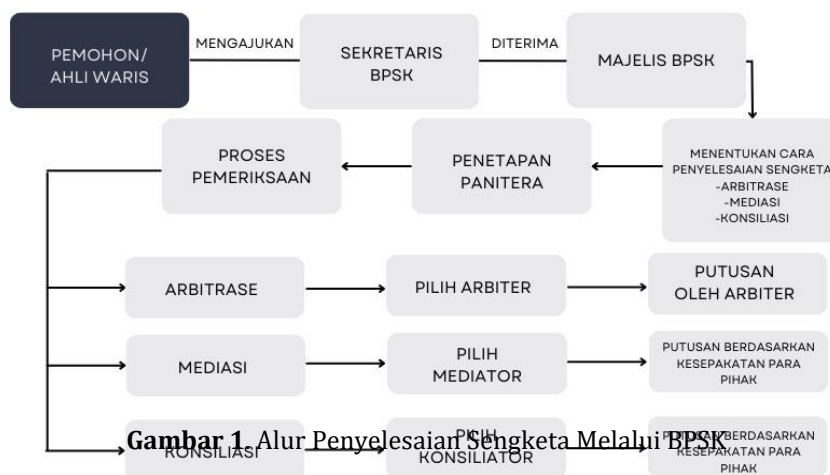
Gambar 1. Alur Penyelesaian Sengketa Melalui BPSK