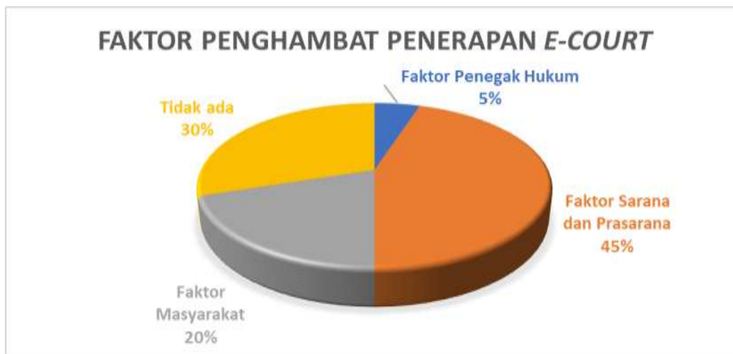
Gambar 1. 2 Faktor Penghambat Penerapan E-Court

Berdasarkan diagram di atas diperoleh bahwa 5% mengaku belum pernah memperoleh sosialisasi terkait layanan e-court , hal ini terkait dengan faktor penegakan hukum. Selain itu, 45% responden menyatakan pernah mengalami kendala jaringan saat menggunakan e-court , hal ini terkait dengan faktor sarana dan prasarana. Dari sisi faktor masyarakat, diperoleh hasil 20% responden merasa kesulitan mengoperasikan sistem e-court secara mandiri terutama pada tahap login , pembuatan akun dan unggah dokumen. Hal ini menunjukkan Tingkat literasi digital masyarakat masih menjadi faktor penghambat dalam penerapan e-court dan 30% menyatakan tidak ada kendala dalam penggunaan e-court .